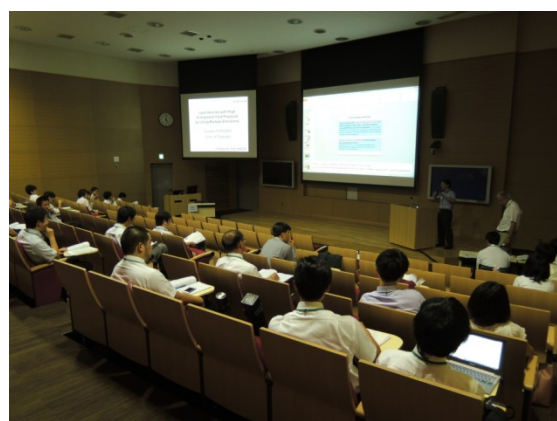
シンポジウム会場の様子