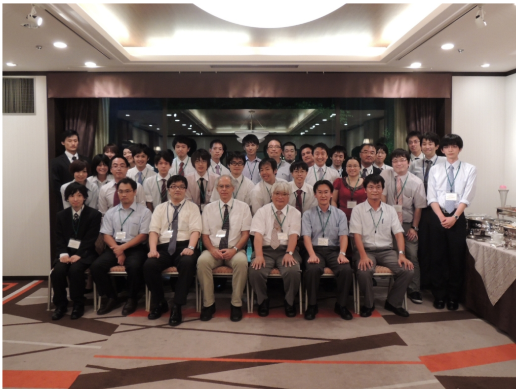
バンケット集合写真