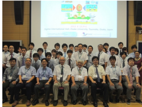
シンポジウム集合写真