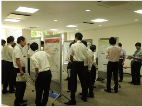
ポスターセッション