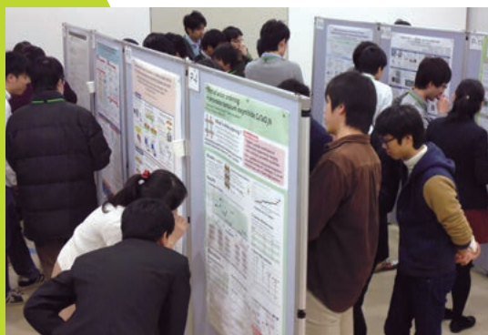
ポスター発表の様子