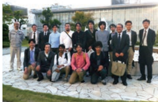
企業見学会に参加した教員、及び履修生

「産・官・学」の連携が求められている昨今、「学」に属している身分で「産」の研究のあり方に触れることができ、将来のキャリアデザインについて非常に刺激を与えてくれた企業見学でした。