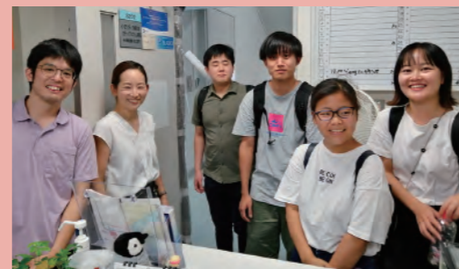
講演会に参加してくれた履修生らと