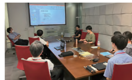
チームで仕事を進める楽しさと難しさを体感する

機械工学専攻の私には化学のバックグラウンドはありませんが、「好奇心」という武器を持って敢えて化学系会社の研究・開発職にチャレンジし、自分のポテンシャルを知りました。