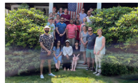
3ヶ月の間に研究員の方々とも親交が深まる

私は2023年6月から9月にかけて、フェローシッププログラムの海外研修として、アメリカ合衆国ロードアイランド州に位置するバイオテクノロジー会社エピバックス(EpiVax Inc.)へ研究留学に伺いました。本研修先は、ワクチンやバイオ医薬品の安全性を評価するための手法開発を行っており、私も自身の研究で扱う遺伝子治療薬をターゲットとして同様の手法開発に取り組みました。就業時間は社員が各自で管理しており、また在宅ワークが可能であるなど、自由に働きやすい環境が整っていました。わからないことがあればすぐに研究員の方々から教えてくださり、実験中も困ったことはないかと何度も優しく声をかけていただいたおかげで、大きなトラブルや滞りなく研究を進めることができました。週に1度はグループ会議で実験結果を共有し、計画をブラッシュアップできるので、チームで知恵を出しながら研究を進めていくことは万国共通であることを改めて実感しました。また、社員の方々から様々な文化的イベントにも招待していただき、多彩な経験も積むことができました。